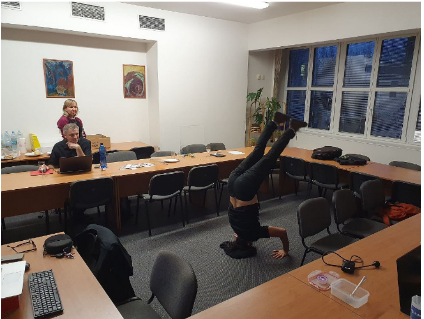
Kolektiv autorů IS/STAG